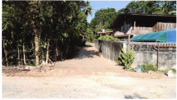
๙. โครงการก่อสร้างถนนคอนกรีตเสริมเหล็ก สายโต๊ะชูด - ฝ่ายโต๊ะฮีเล หมู่ ๖